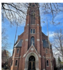
St. Nicholas Church / Iglesia de San Nicolás